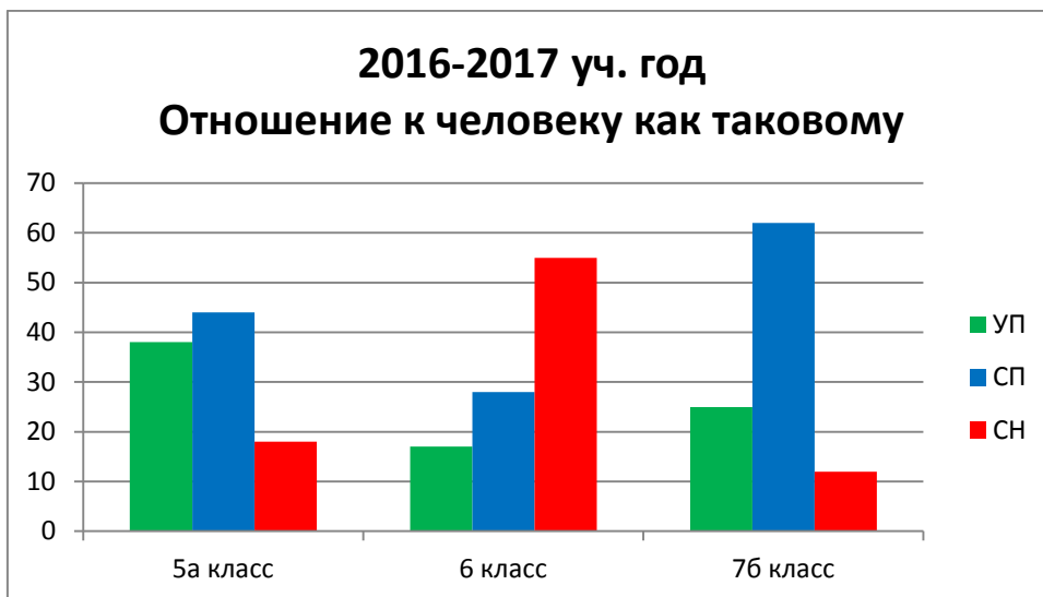
Рисунок Б.1 - Данные по критерию «Отношение к человеку как таковому»